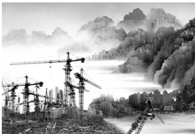
Yang Yongliang, The Sunk Ship . Fonte: www.yangyongliang.com

Dai corpi allo spazio che abitano, con le opere di chi è stato definito "l'artista dell'apocalisse", Yang Yongliang , i cui lavori nascono da sovrapposizioni di fotogrammi e si trasformano in opere monumentali che sembrano pronte a esplodere. Archeologia industriale che svela la cementificazione massiccia della Cina degli ultimi decenni, una Cina urbana che vive, però, nel cuore dell'immensa natura.