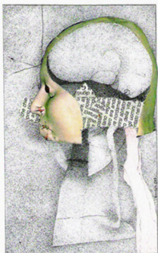
Nèura !! s.f. [nèu-ra] Acronimo di "Non È Una Rivista d'Arte"

È possibile utilizzare questi tag ed attributi XHTML: <a href="" title=""> <abbr title=""> <acronym title=""> <b> <blockquote cite=""> <code> <del datettime=""> <em> <i> <q cite=""> <strike> <strong>